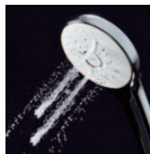
Power:パワーマッサージ